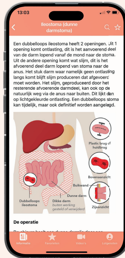
De uitlegpagina van een dubbelloops ileostoma